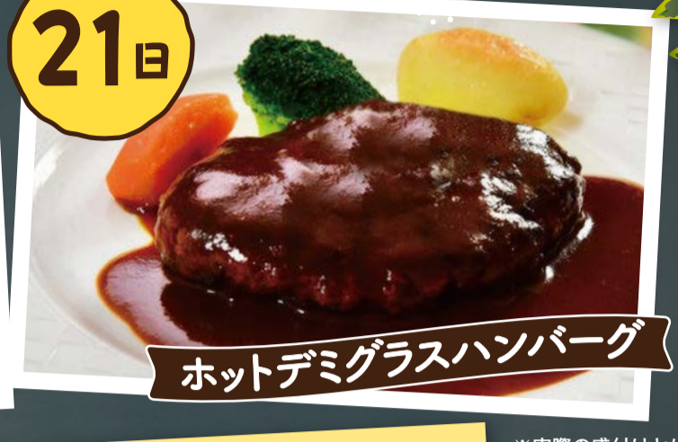
ホットデミグラスハンバーグ