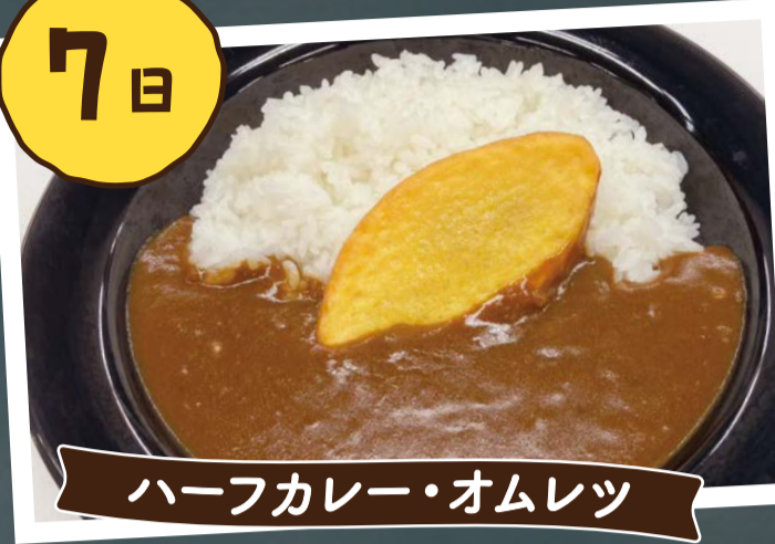
ハーフカレー・オムレツ